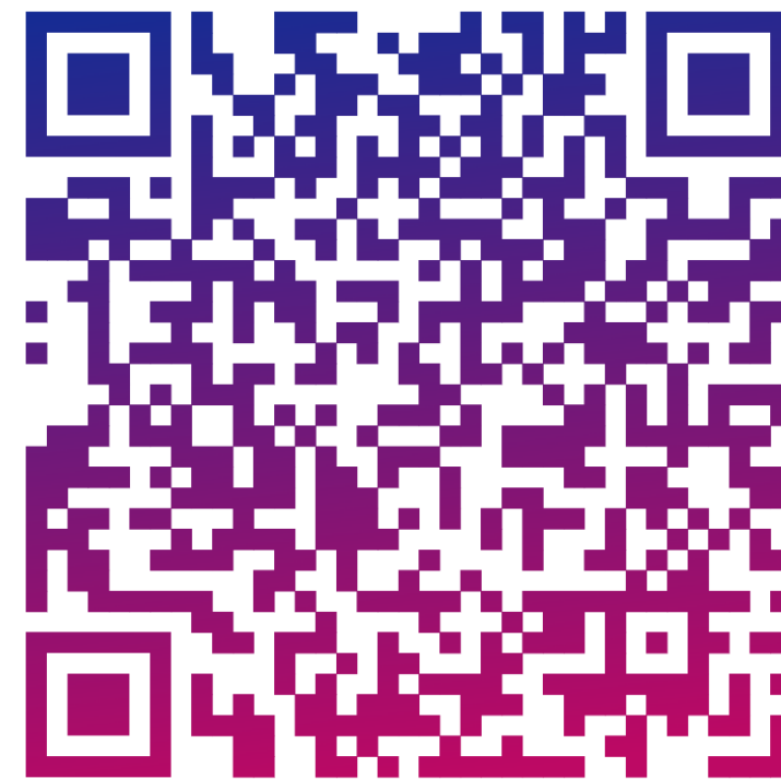
QR на лендинг